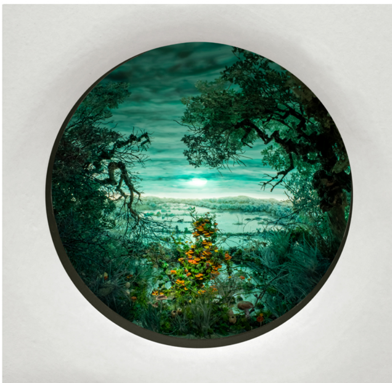
Patrick Jacobs

Varcando la soglia di THE POOL NYC ci vengono riservate diverse sorprese. Innanzitutto scoprire che si tratta della prima galleria itinerante che per otto anni ha organizzato mostre da Mexico City a NYC, passando per l'Asia, e scegliendo poi di sostare a Milano e continuare così la sua attività da qui. Poi sicuramente la scelta di esporre Patrick Jacobs e darci l'occasione di entrare nel suo mondo. Artista americano che sonda e naviga il mellifluido mondo del sogno, dell'eros, e del voyeurismo. Lo fa contemplando la natura, nelle sue diverse forme, donandoci la sensazione che ciò che di giorno appare naturale, la notte si converta nel territorio del desiderio e di caccia della sua mente. Una natura stimolante, allettante, sensuale che proclama un paesaggio inteso come luogo e oggetto del desiderio. La prima sala della galleria accoglie disegni carmini e sculture antropomorfe che svelano parte di questi desideri, a seguire, nella stanza principale, i diorami, e Jacobs a sua volta ci trasforma in viziosi scrutatori del suo mondo attraverso lenti che aprono immensi mondi ricchi di dettagli di cui non vorresti smettere di nutrirti mai. Poi, come a svelare qualche retroscena, troviamo in una bacheca tutto ciò che è disegno, preparazione e diario di bordo del mondo parallelo che abita lo spirito di questo intenso e maniacale artista.